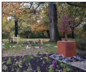
P 21 EEN ENGELTJESBOOM OP BEGRAAFPLAATS RONSE!