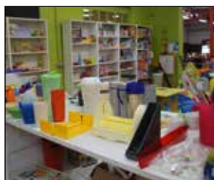
P 4 DE KRINGWINKEL BESTAAT 20 JAAR IN RONSE