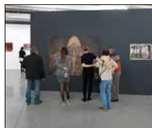
P 7 RONSE DRAWING PRIZE EVEN UITGESTELD