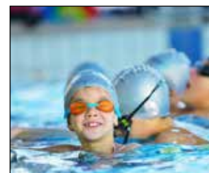
P 13 NIEUW ZWEMTRAJECT IN 'T ROSCO