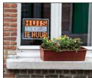
P 8 HET CONFORMITEITS- ATTEST VOORTAAN VERPLICHT