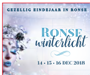
P 8 GEZELLIG EINDEJAAR IN RONSE