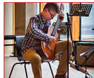
P 20 VERNIEUWING AAN- BOD KUNSTACADEMIE