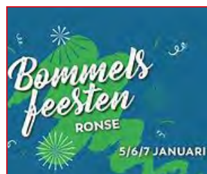
P 14 BOMMELSFESTEN 2019