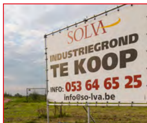
P 22 FASE 1 PONT-WEST BIJNA AFGEROND