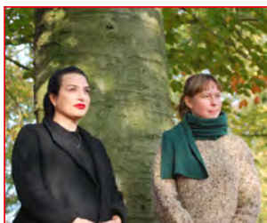
P 4 50 JAAR RONSE DRAWING PRIZE