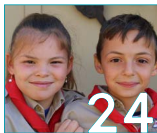
JEUGD: JUBILEUM KADETTEN RONSE