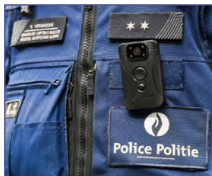
P 26 POLITIE RONSE GEBRUIKT BODYCAM'S