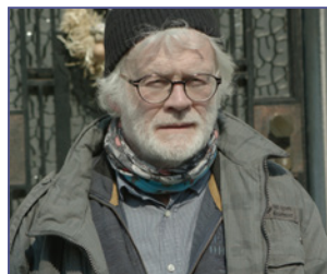
P 13 ADAM & EVA : FILM IN DE VLAAMSE ARDENNEN