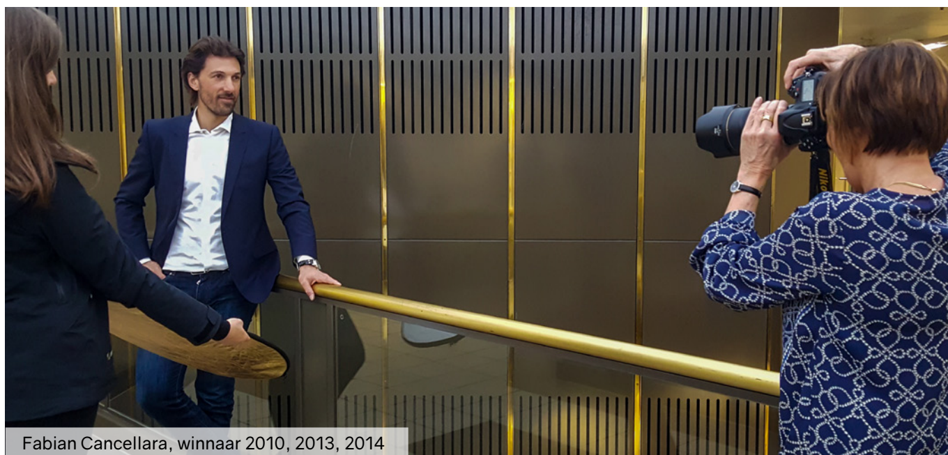
Fabian Cancellara, winnaar 2010, 2013, 2014

Erwin Van den Sande, eindredacteur Sportweekend, gaat in gesprek met Anneke. Woensdag 25 maart om 20 u. in de bibliotheek van Ronse. Gratis toegang.