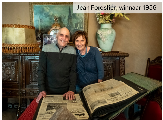
Jean Forestier, winnaar 1956