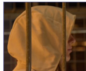
P 14 DIDO 2.0 : OPERA DOOR LEERLINGEN KUNSTACADEMIE